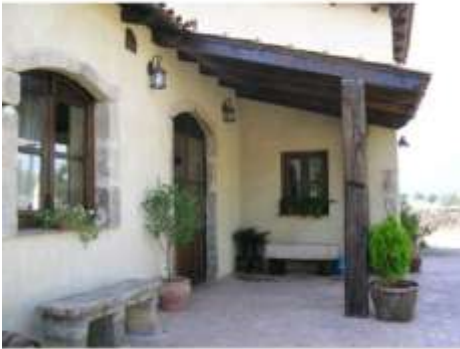
Cabaña o bungalow - Apartamento turístico rural 2 - 60 plazas